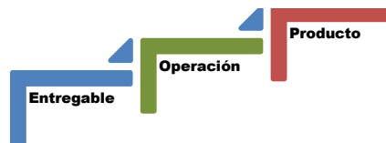
Figura 1. Esquema Bottom up