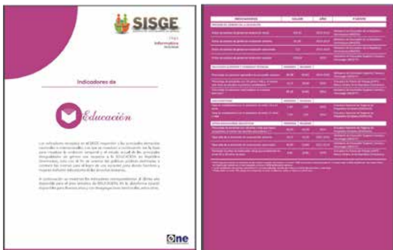
Ejemplo: Hoja Informativa, del Subportal Educación, en el SISGE

Las hojas informativas están a la disponibilidad de los usuarios en la página Web de la ONE, y se han creado para cada uno de los ejes temáticos, tomando en cuenta la línea gráfica y los colores de la plataforma, de modo que cada sub-producto del sistema mantenga la armonía.