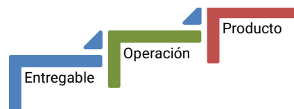
Figura 1. Esquema Bottom up

Fuente. Departamento de Planificación y Desarrollo, Estructura POA 2021.