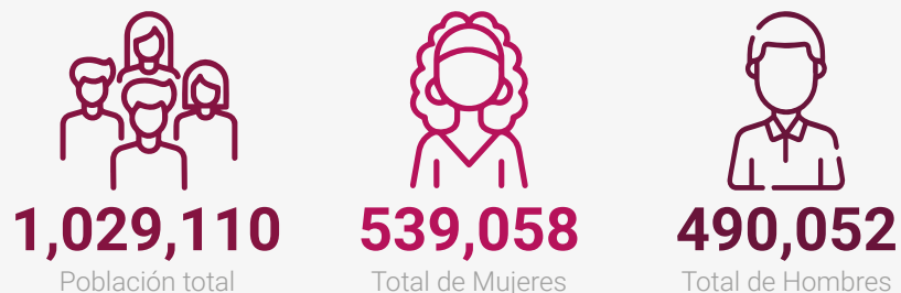
Población del municipio por sexo, 2022

Fuente: X Censo Nacional de Población y Vivienda 2022, ONE.