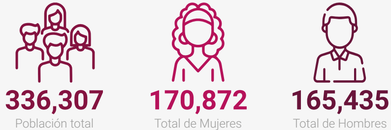
Población del municipio por sexo, 2022

Fuente: X Censo Nacional de Población y Vivienda 2022, ONE.