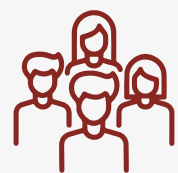
Población del municipio por sexo, 2022