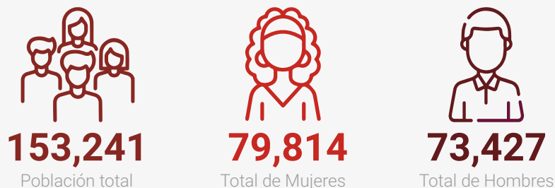
Población del municipio por sexo, 2022