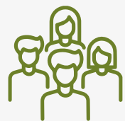
Población del municipio por sexo, 2022