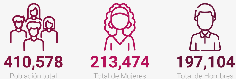
Población del municipio por sexo, 2022