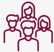
Población del municipio por sexo, 2022