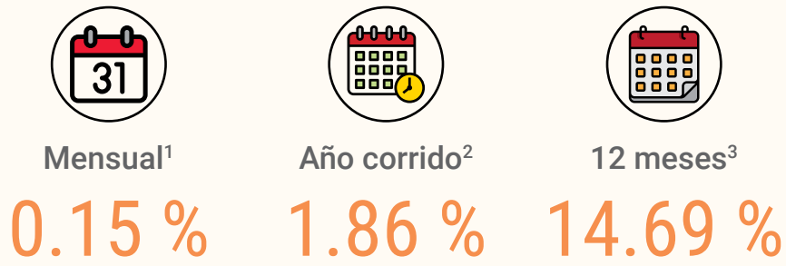
REGIÓN METROPOLITANA: Índice de Costos Directos de la Construcción de Viviendas, de enero del 2021 a febrero del 2022